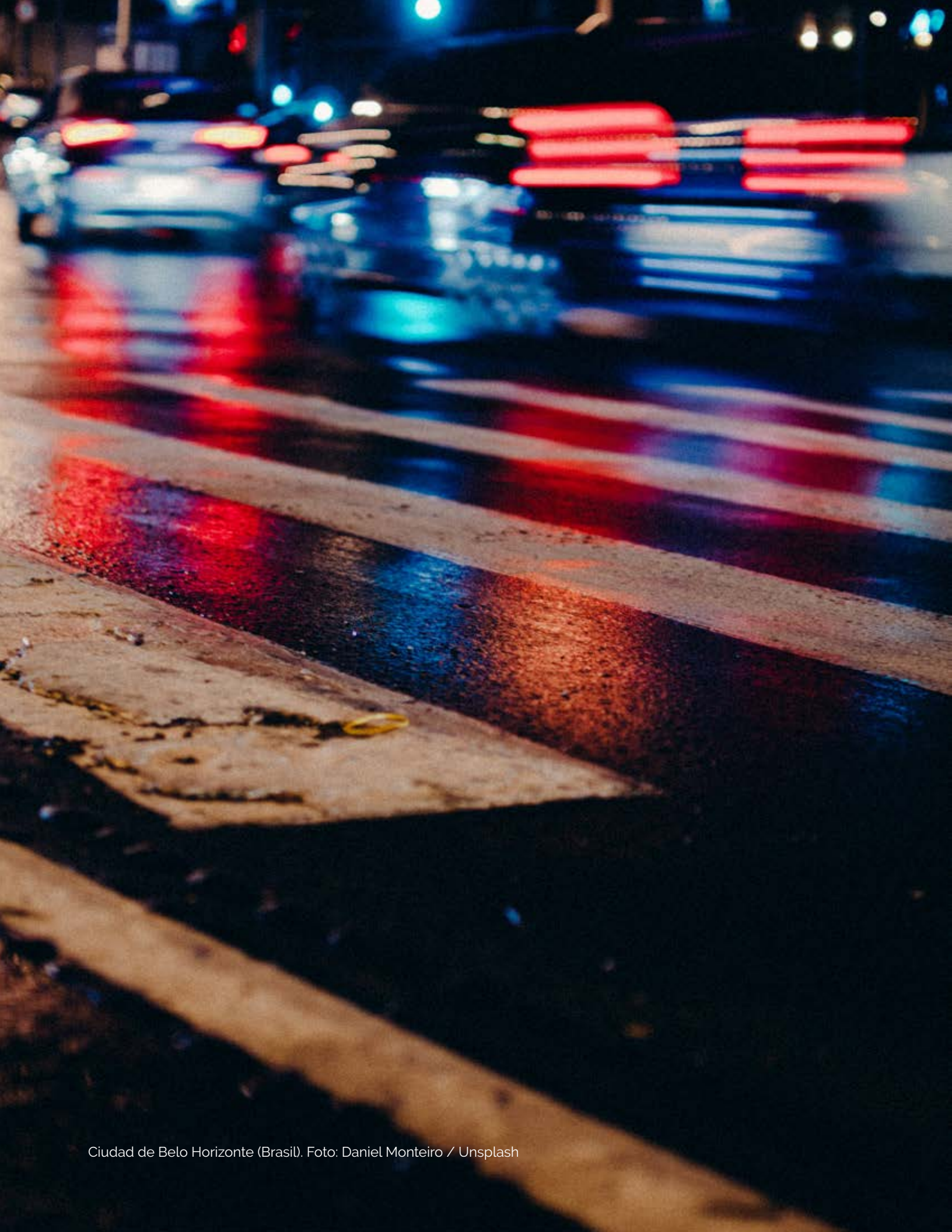
Ciudad de Belo Horizonte (Brasil).