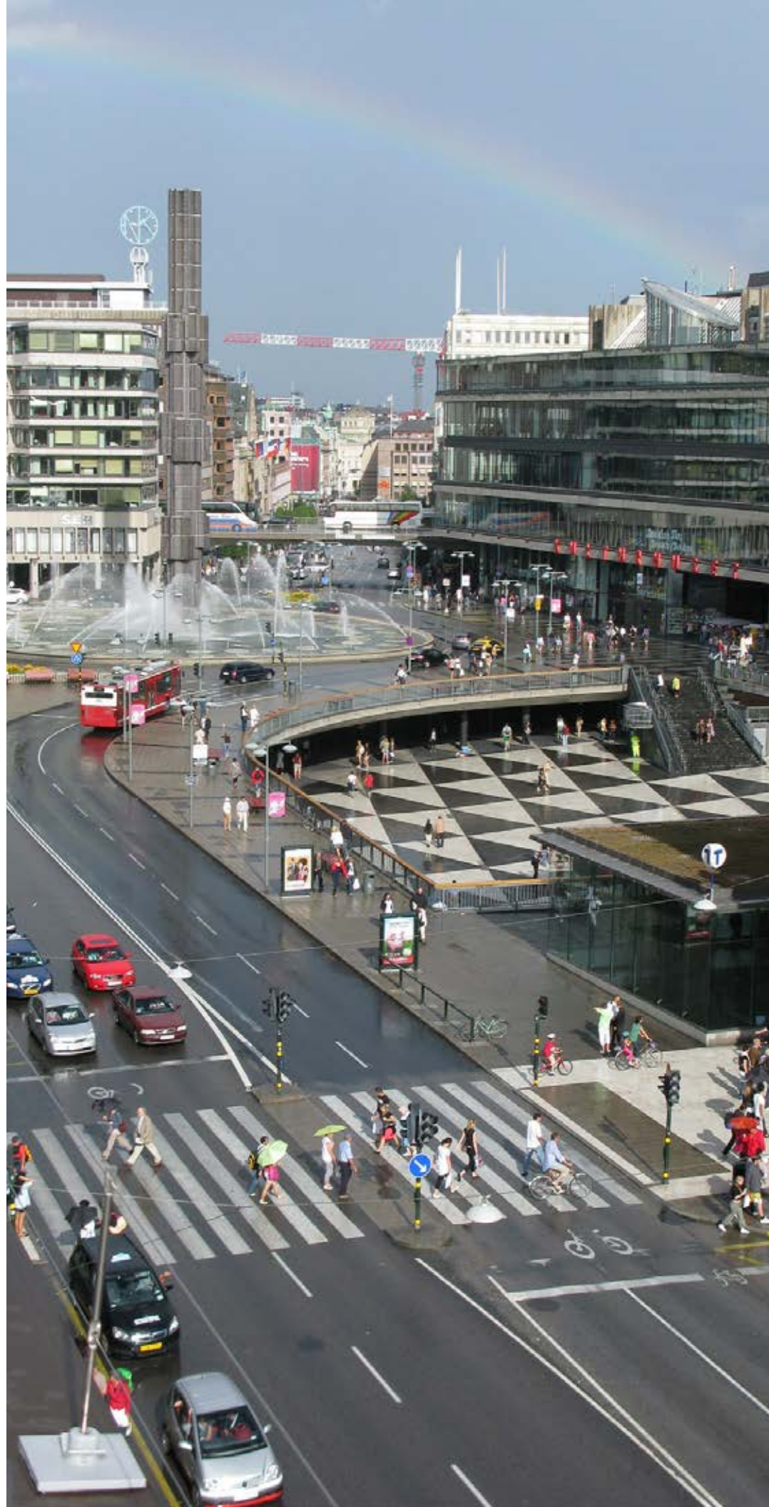
Ciudad de Estocolmo (Suecia).