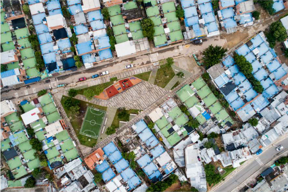
Parque Ciudadela Café Madrid de Bucaramanga, 2018.