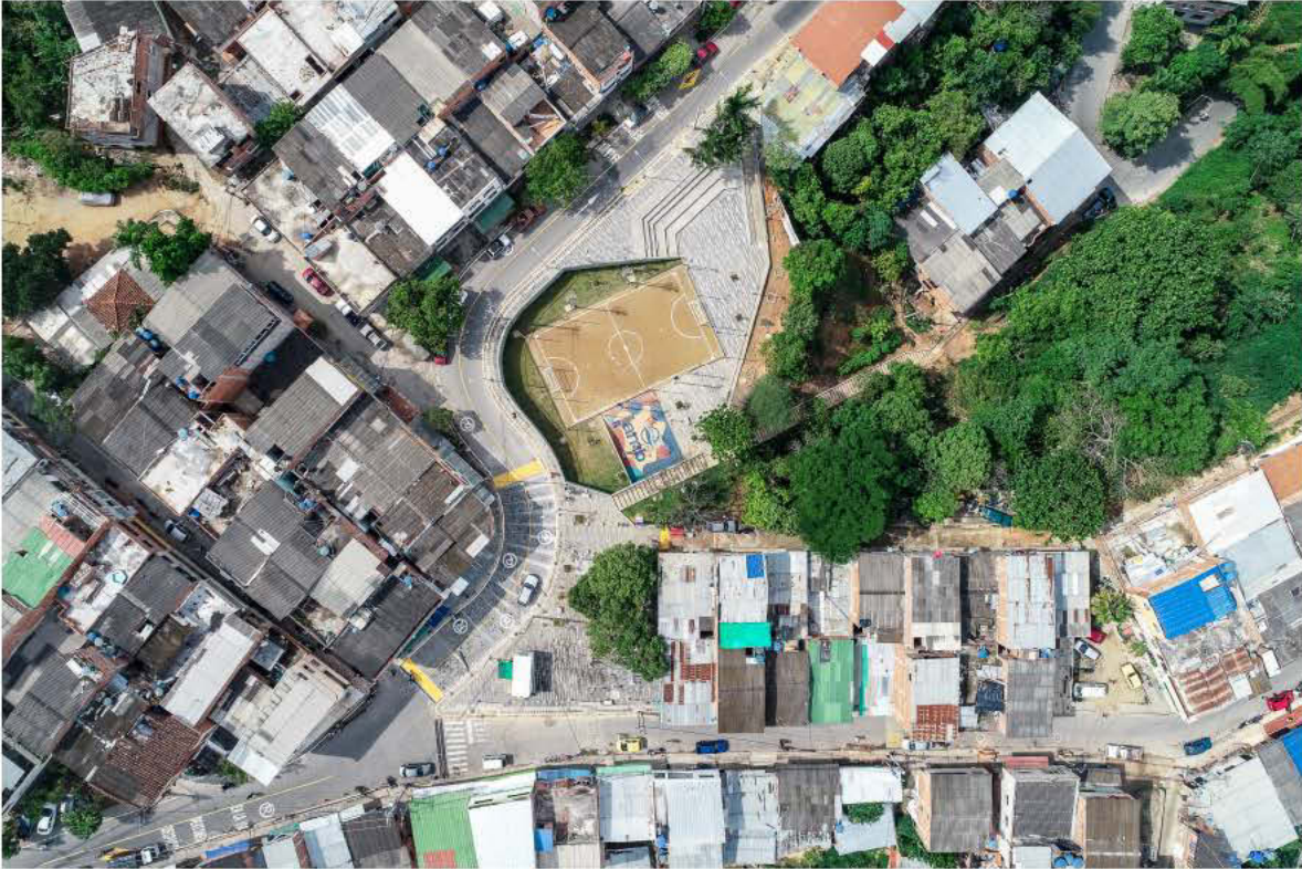
Foto: Alejandro Arango – Parque Cristal Alto de Bucaramanga, 2018.