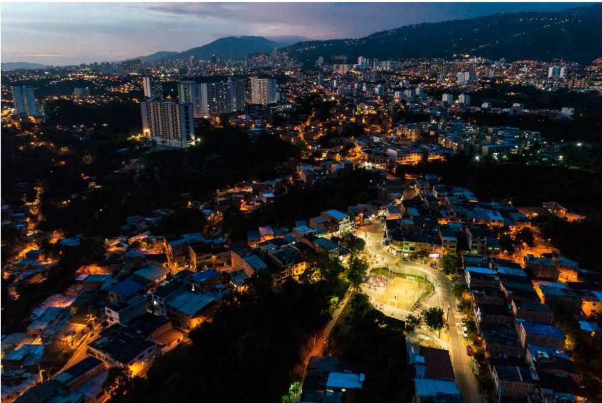
Foto: Alejandro Arango – Parque Cristal Alto de Bucaramanga, 2018.