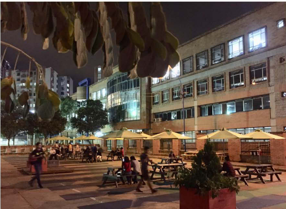
Foto: Iván Acevedo, Arquitecto – Calle de los estudiantes de Bucaramanga, 2018.