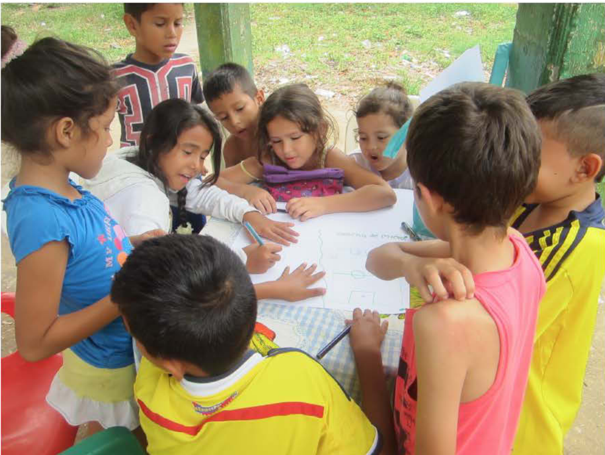
Foto: Mayerly Medina, Trabajadora Social – Parque Café Madrid de Bucaramanga, 2017.

Aunamos esfuerzos por la arquitectura pública de alta calidad y el urbanismo como herramienta para la inclusión social, la pedagogía cívica y la transformación física del territorio, permitiendo la construcción y desarrollo de la identidad y el