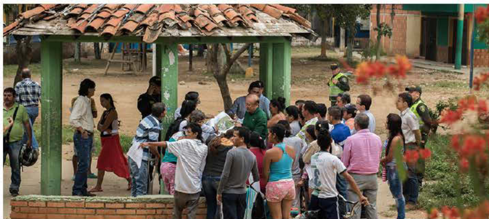
Ilustración 5.1 | Foto Parque Ciudadela Café Madrid (Antes)

Parque Ciudadela Café Madrid de Bucaramanga, 2017.