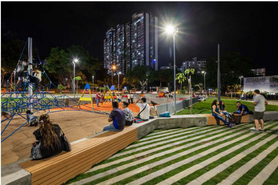
Parque de los Sueños de Bucaramanga, 2018.

(*) Estrategias: “Parques de Calidad”, “Bosques que conectan” y “Ciudad de los Ciudadanos” (Realización de intervenciones de Urbanismo Táctico; Renovación y rehabilitación de escenarios