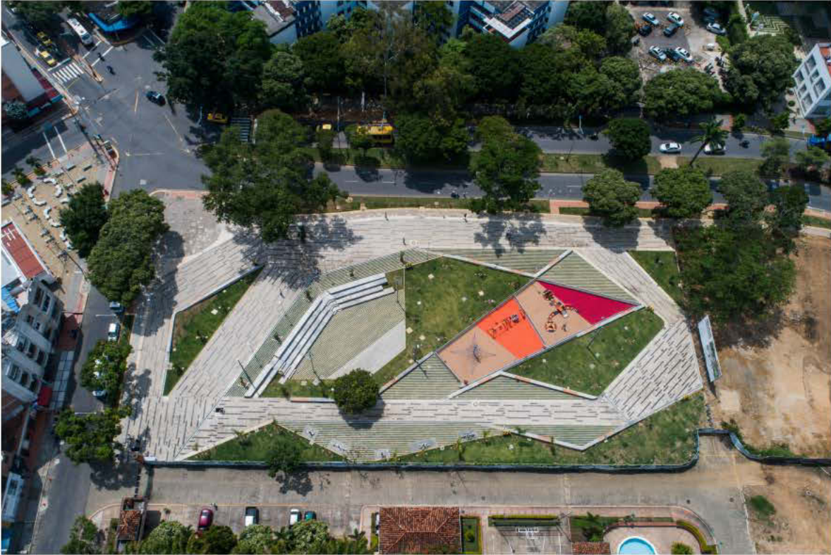
Parque de los sueños de Bucaramanga, 2018.

“En Bucaramanga diseñamos ciudad con los ciudadanos”!